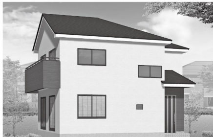
※12号棟イメーシバース。実際の色等は異なる場合があります。